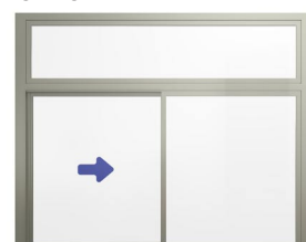
XO med överljus